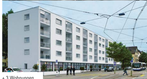
+ 3 Wohnungen