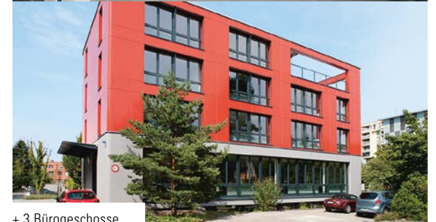
+ 3 Bürogeschosse